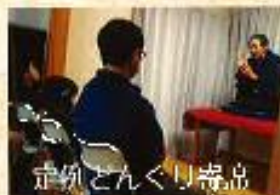
定例とんぐり寄席